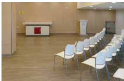
瑪麗醫院內的「惜別間」