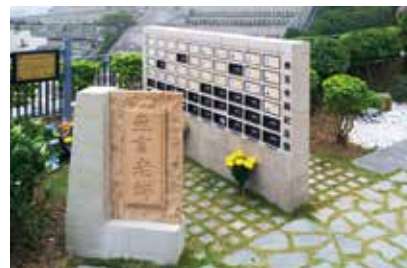
華永會將軍澳紀念花園 “無言老師”紀念壁