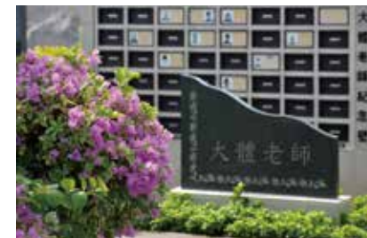
華永會將軍澳紀念花園 “大體老師”紀念壁