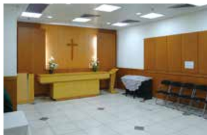
東區醫院內的「永寧軒」