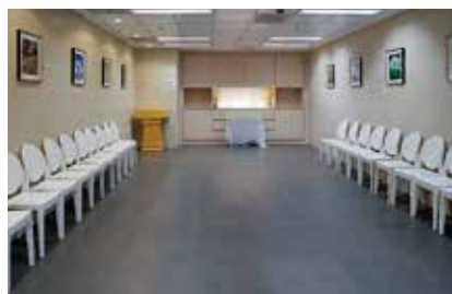
威爾斯親王醫院內的「靜念堂」