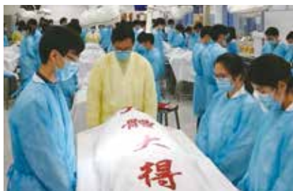
香港大學醫科學生向 “大體老師”遺體致敬