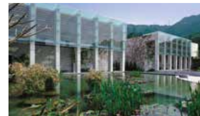
鑽石山火葬場 九龍黃大仙蒲崗村道199號 電話：2325 9996