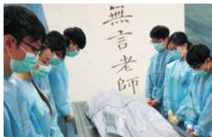
香港中文大學醫科學生向 “無言老師”遺體致敬