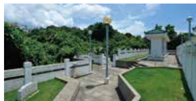
坪洲紀念花園 坪洲靈灰安置所 電話：2981 5177