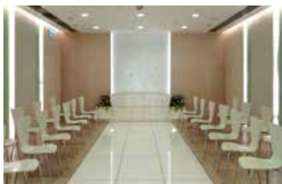
博愛醫院內的「寧心軒」