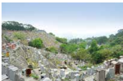
和合石墳場 新界粉嶺銘賢路 電話：2675 5296