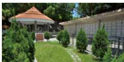
長洲紀念花園 長洲西灣長洲山頂道西 電話：2981 5177