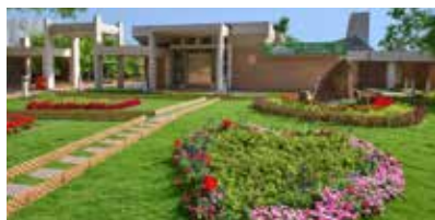
新葵涌紀念花園 新界葵涌永孝街13號 電話：2614 4390