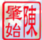
食物及衛生局局長 陳肇始教授，JP

我期盼綠色殯葬能成為處理骨灰的主流安排，並鼓勵大家預先向親人明確表達身後事的意願，令自己放心，至親也安心。大家更可透過“無盡思念”網站 ( memorial.gov.hk ) 隨時隨地追思先人，讓思念回憶歷久彌新。